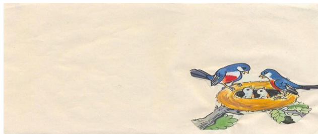
Fig. 3. Hoja de trabajo: Franelógrafo

Con plastilina los niños modelarán gusanos de diferentes tamaños para ofrecerlo como alimento a los pajaritos que acababan de nacer.