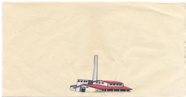
Fig. 4. Hoja de trabajo: Central azucarero

Es importante tratar elementos sobre el cuidado del medio ambiente.