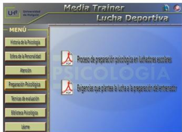
Fig. 4. Opción Preparación psicológica