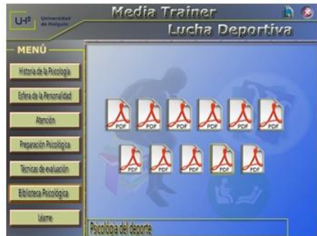
Fig. 6. Opción Biblioteca psicológica