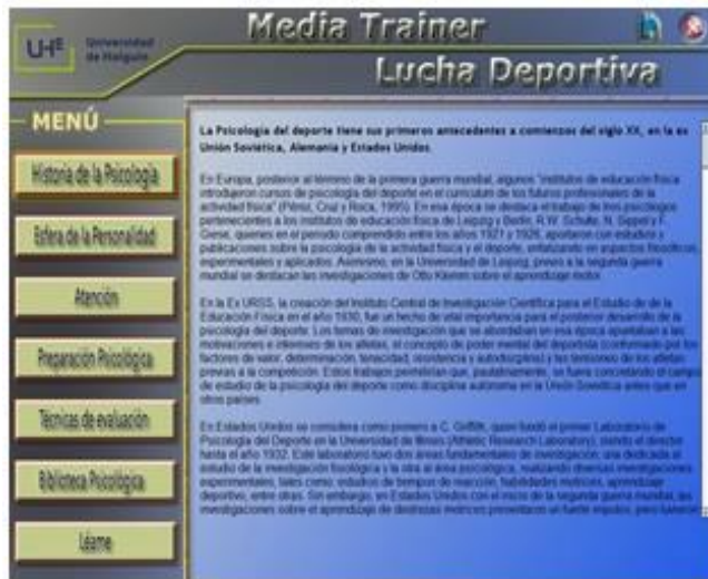
Fig. 1. Opción historia de la Psicología