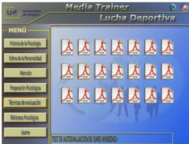
Fig. 5. Opción Técnicas de evaluación