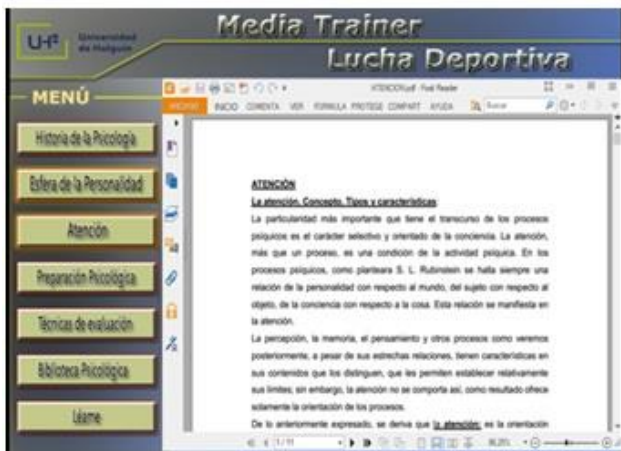
Fig. 3. Opción Atención