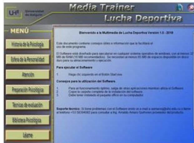
Fig. 7. Opción Léame