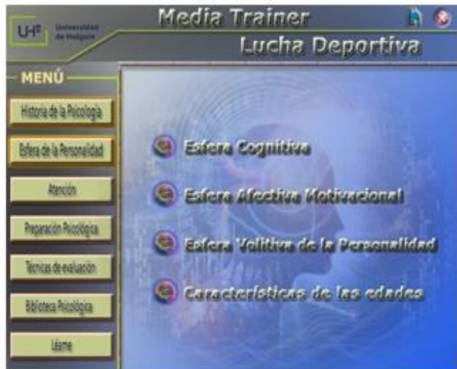
Fig. 2. Opción Esfera de la personalidad